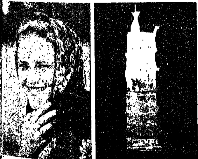
قطرة من خلال سواد اللغة... للجنة الصلح العالمي في ١٩٧٠